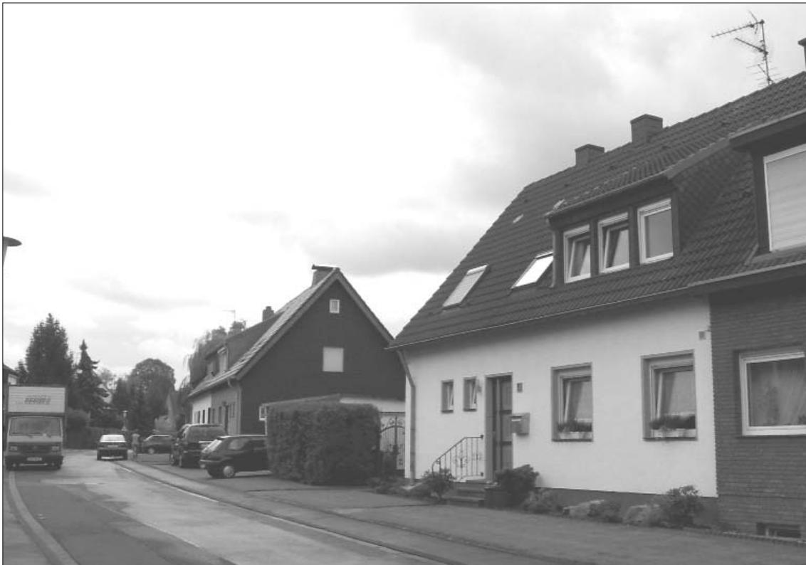
Die Hans-Böckler-Straße im Herbst 2005

schon in Anbetracht der sich zwangsläufig einstellenden Geruchs- und Lärmbelästigung mit Hühnern, Gänsen, Karnickeln oder ähnlichem unter einem Dach leben. Andererseits ging es aber um die Einhaltung der gesetzlichen Vorgabe und so entstanden kurzfristig — eigens für den Abnahmetag durch Beamte der Landesregierung — mit viel Sorgfalt und Phantasie hergerichtete Stallräume mit Leih-Kaninchen und Leih-Hühnern. Auch wurden Kaninchenställe mit entsprechender Strohausstattung von Abnahmetag zu Abnahmetag weitergereicht.