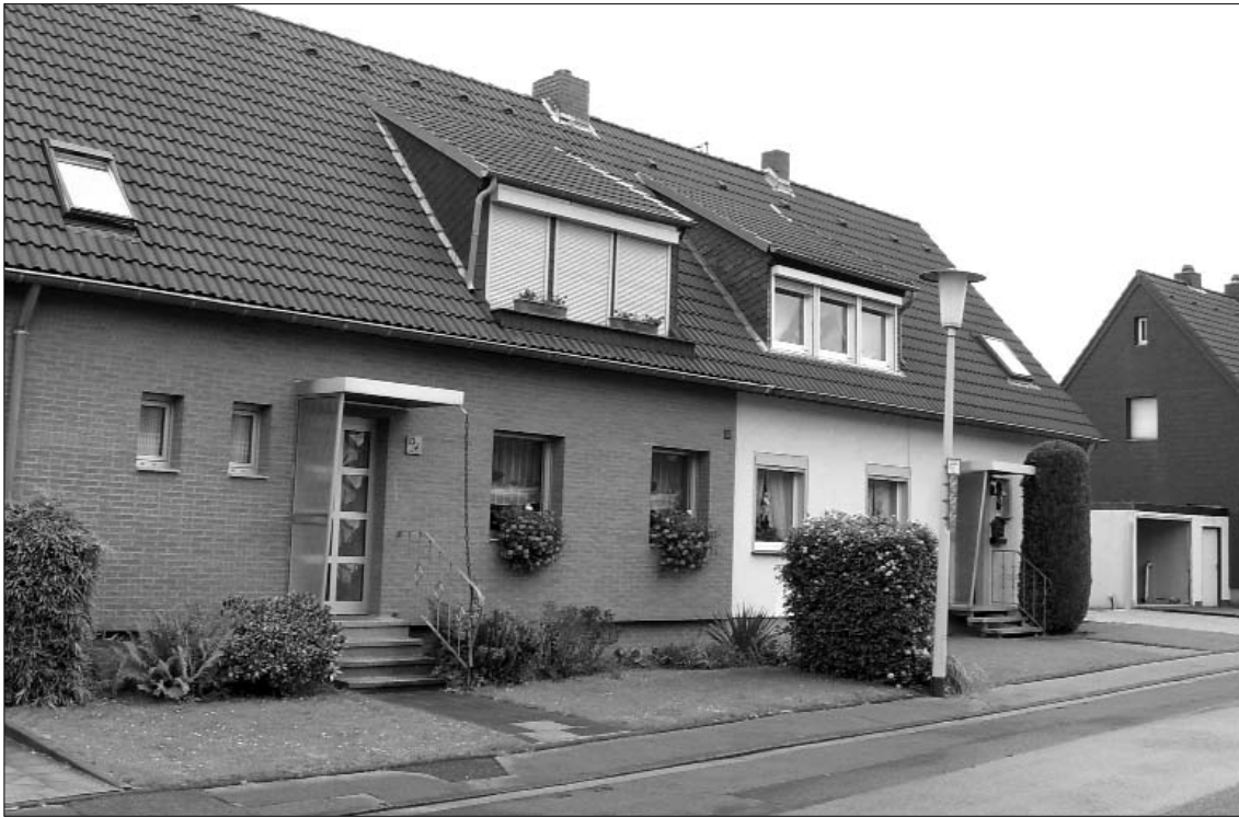
In den vergangenen 50 Jahren sind die Häuser der ehemaligen Hans-Böckler-Siedlung vielfach um- und ausgebaut worden. Auch die Eigentümer haben gewechselt.

anwesenden Bürgermeister Johann Schmitz im letzten Moment abgewendet werden. Aber auch hier wusste man sich letztlich zu helfen. Sobald die Stall- bzw. Wirtschafts-Räume von der Bauverwaltung abgenommen waren, wurden aus diesen Räumen die schönsten Badezimmer. Um die Wohnungsnot weiter zu mindern, wurde dann noch im Obergeschoss des Hauses eine sogenannte Einliegerwohnung geschaffen.